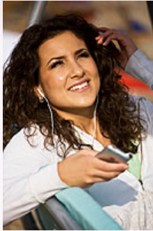
Wien am I-Pod

Ihr eigener Mp3-Player leitet Sie durch die Stadt und erzählt Ihnen was Sie gerade sehen.